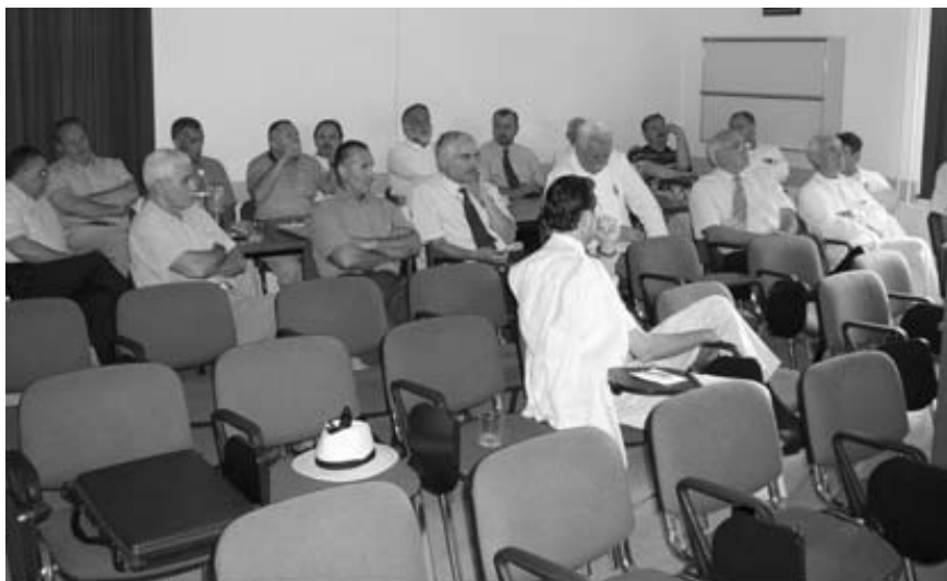
Sastanak Inicijativnog odbora.