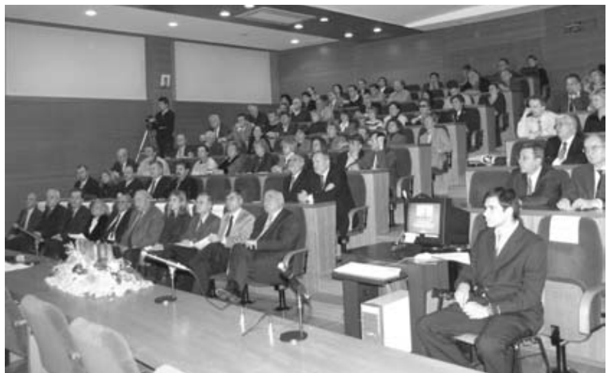
Delegati Hrvatskog društva za štitnjaču