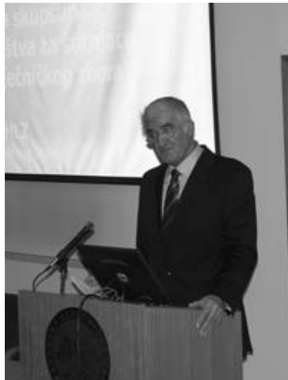
Akademik Zvonko Kusić

ve područjem štitnjače, osobito iz manjih centara. Oni će se moći naknadno učlaniti u Društvo.