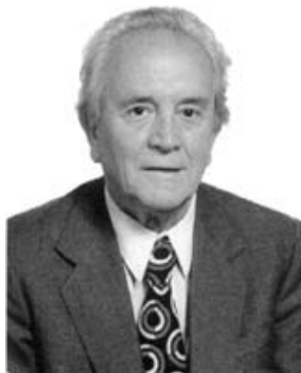
Akademik Mladen Sekso

Akademik Mladen Sekso je utemeljio međunarodno priznati Zavod za endokrinologiju, organizirao prvi poslijediplomski studij iz endokrinologije a kao dekan Medicinskog fakulteta i kao predstojnik Klinike za internu medicinu odgojio je niz uglednih stručnjaka i znanstvenika.