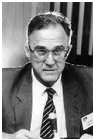
Akademik Zdenko Škrabalo

Stručni sastanci Društva će se održavati u različitim gradovima Hrvatske, što će doprinijeti podizanju razine zdravstvene skrbi i u manjim sredinama.