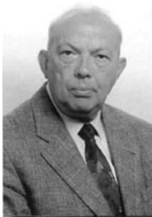
Akademik Šime Spaventi

Akademik Šime Spaventi koji je kao onkolog i nuklearni medicinar utemeljio najsuvremeniju Kliniku za onkologiju i nuklearnu medicinu s multidisciplinarnim pristupom i time omogućio kompletnu dijagnostičku i terapijsku obradu bolesti štitnjače unutar jedne ustanove. Odgodio je niz stručnjaka i znanstvenika.